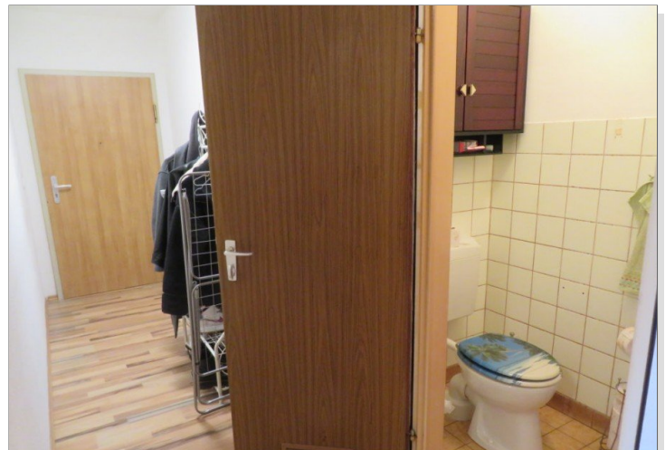
9 Eingang Flur