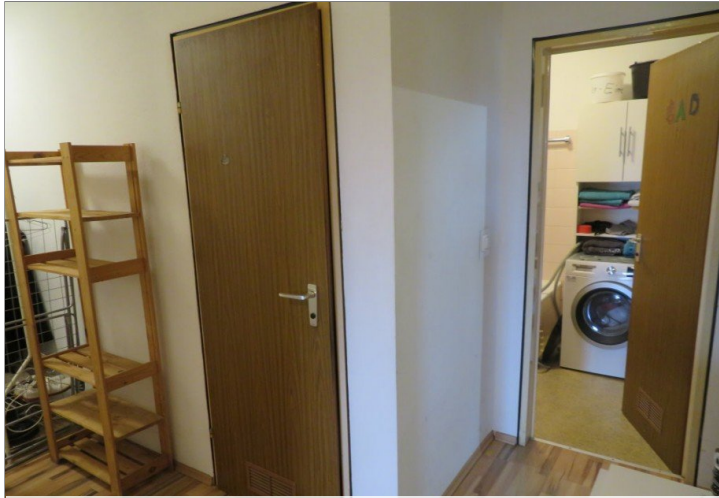
11 Flur+Blick Bad