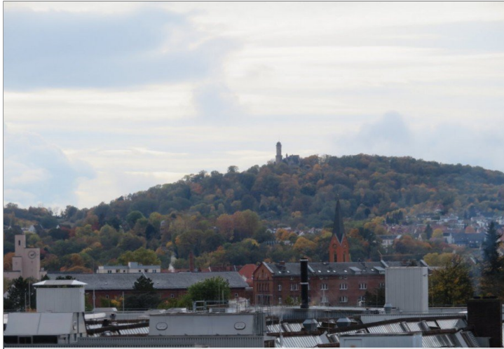
3 Vergrößerter Blick vom Balkon