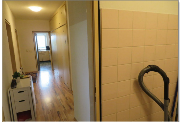
14 Bad+Blick Flur