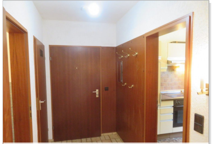
7 Eingang Diele