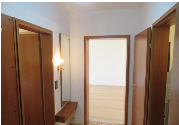
6 Eingang Diele