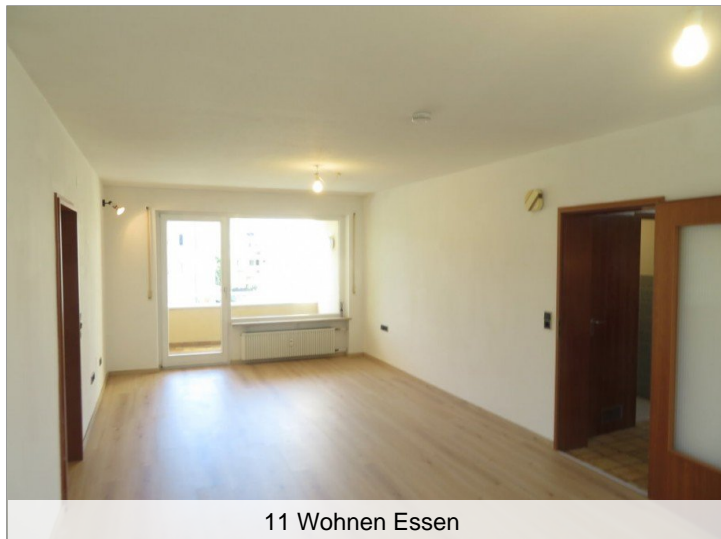
11 Wohnen Essen