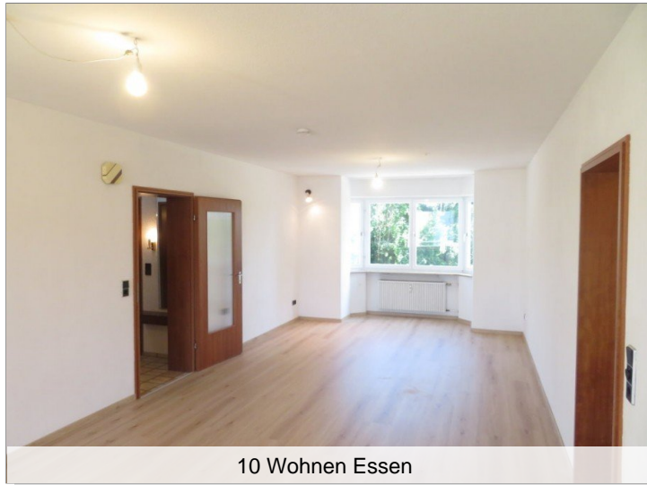
10 Wohnen Essen