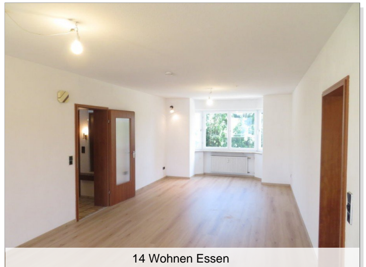
14 Wohnen Essen