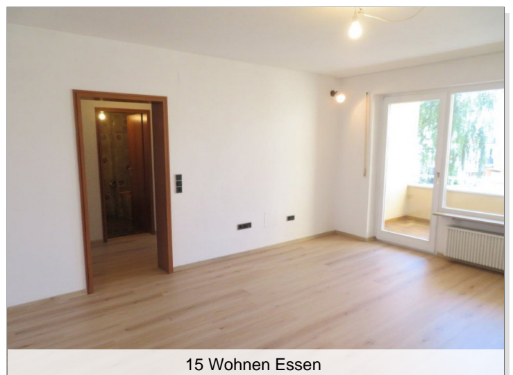
15 Wohnen Essen