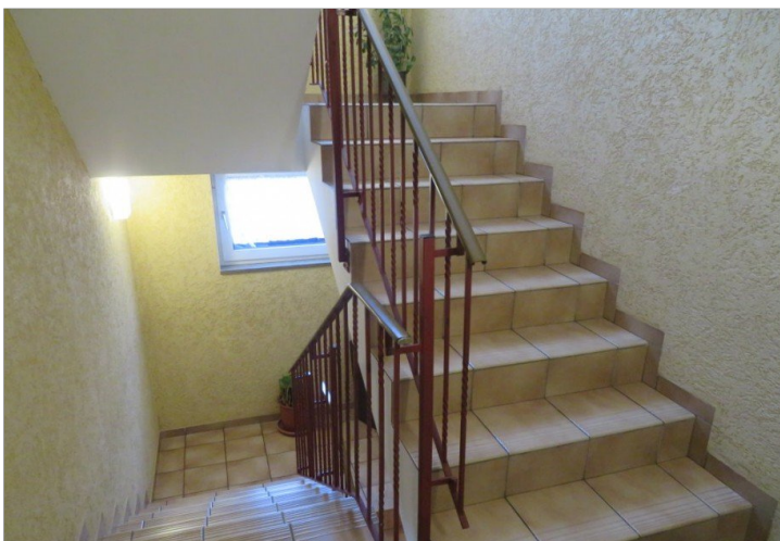
5 Eingang Treppenhaus