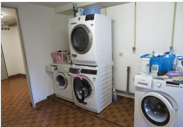
24 Standplatz Waschmaschine im