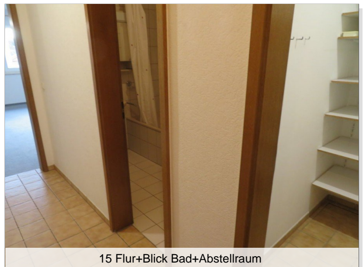
15 Flur+Blick Bad+Abstellraum