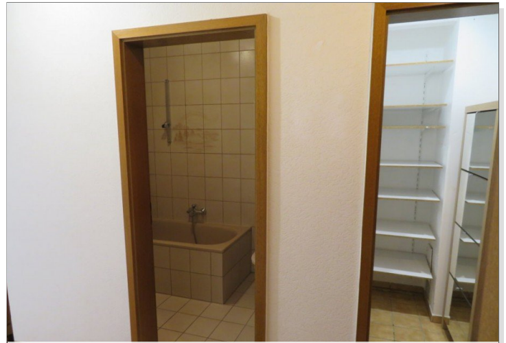
7 Eingang Flur