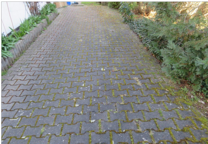
4 Kfz Stellplatz