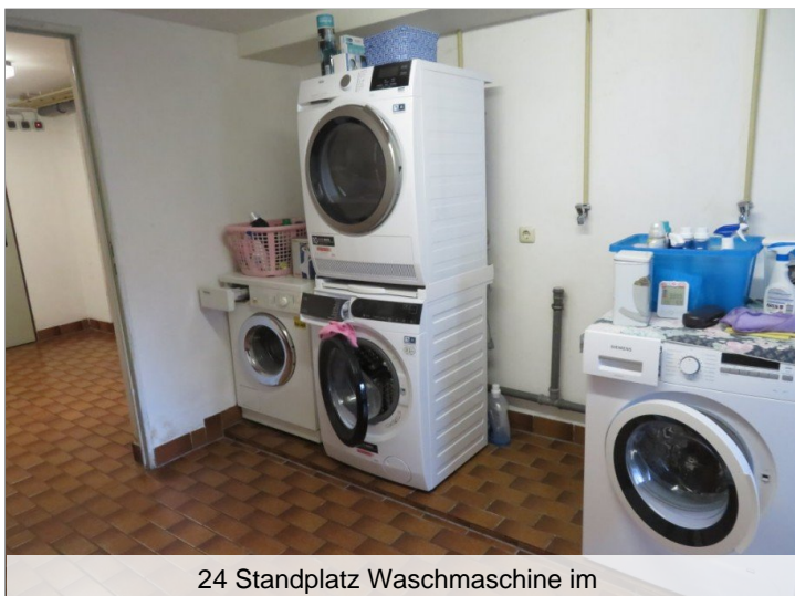
24 Standplatz Waschmaschine im