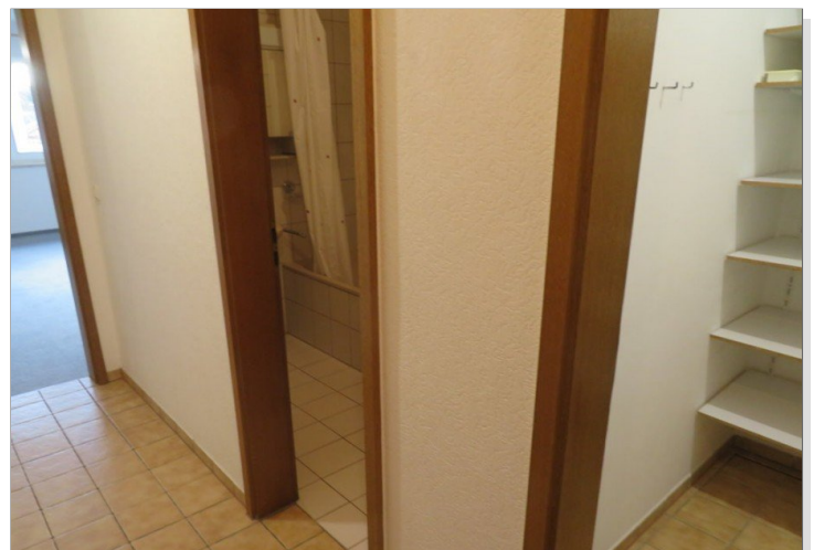
15 Flur+Blick Bad+Abstellraum