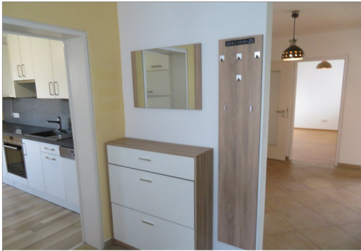
10 Diele +Blick zum Essen