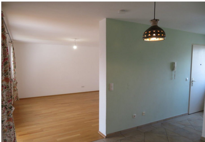
11 Essen+Blick Wohnen