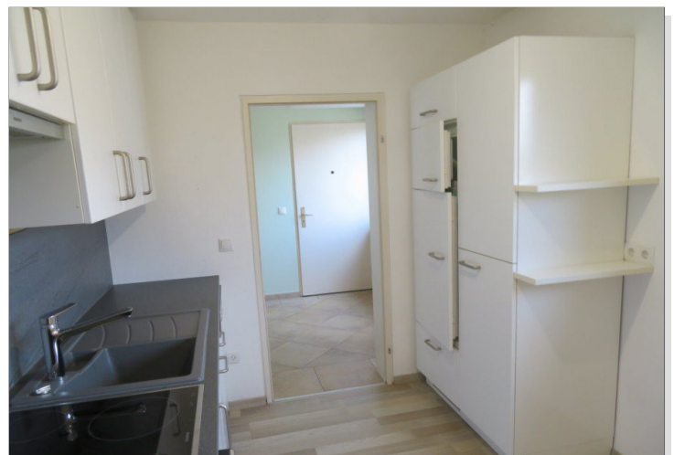
9 moderne Küche