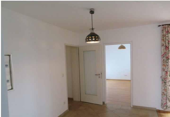
16 Essen+Blick Arbeiten