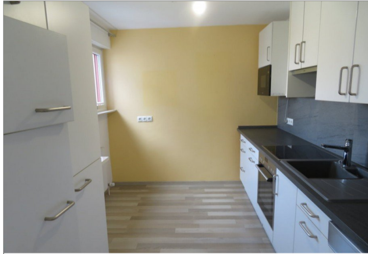
3 moderne Küche