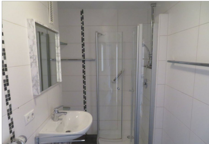
4 modernes Bad