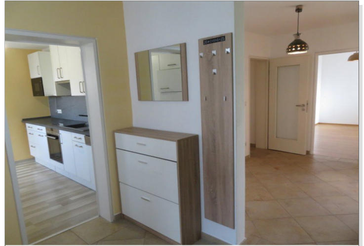
7 Eingang Diele