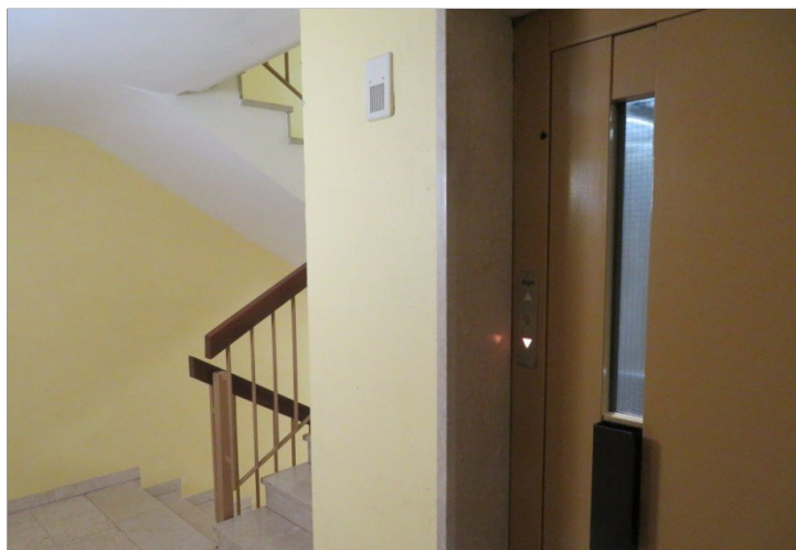
5 Treppenhaus mit Lift