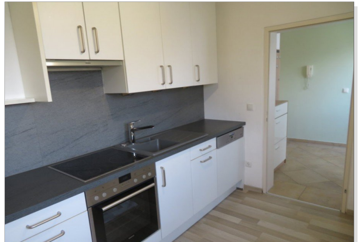
8 moderne Küche