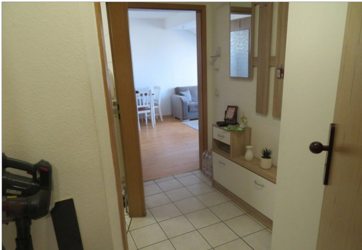
5 Eingang Flur