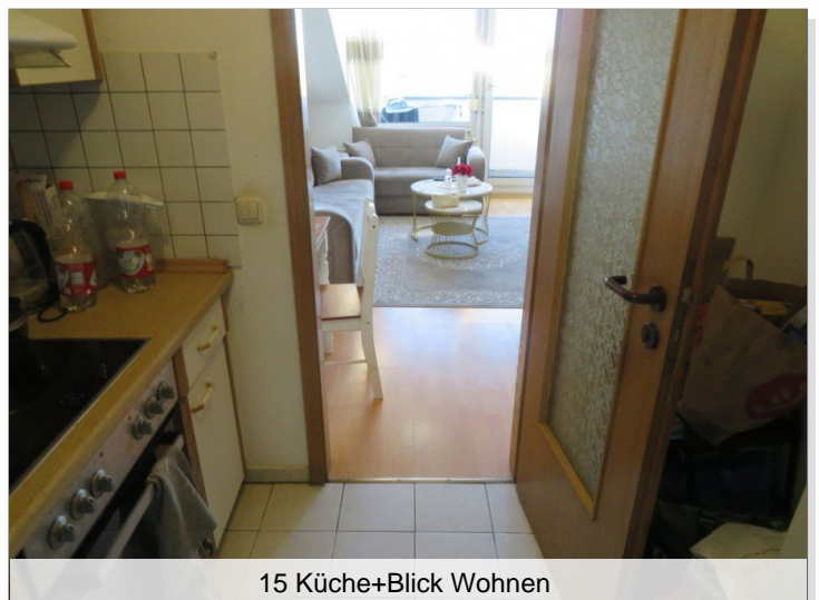
15 Küche+Blick Wohnen