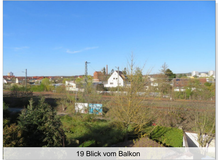
19 Blick vom Balkon