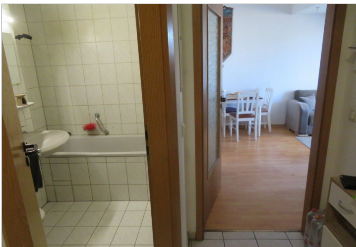
6 Flur+Blick Bad