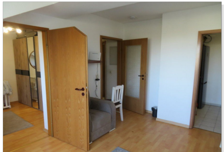
20 Wohnen+Blick Schlafen