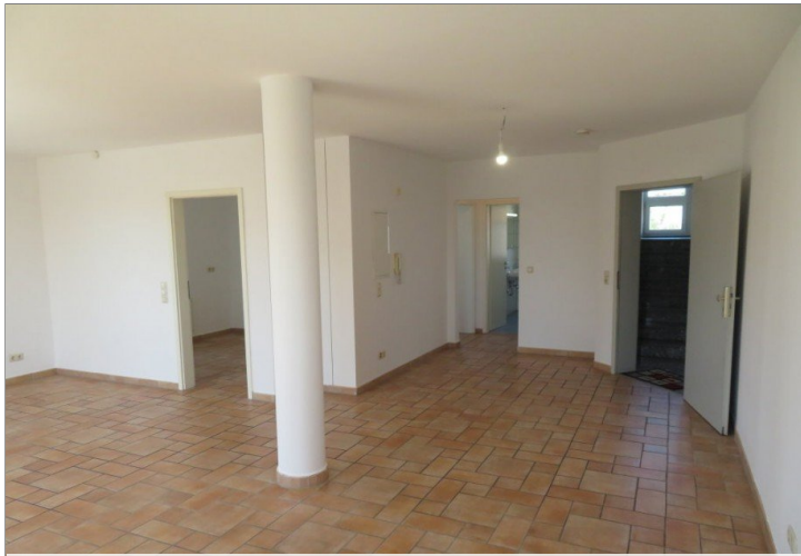
5 Eingang Flur