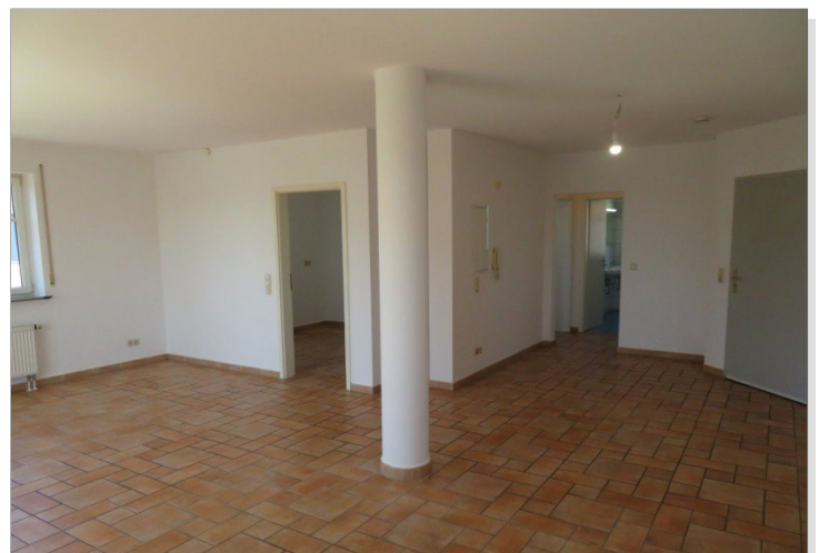
16 Wohnen Essen