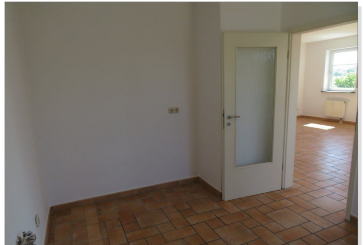
15 Küche+Blick Wohnen Essen