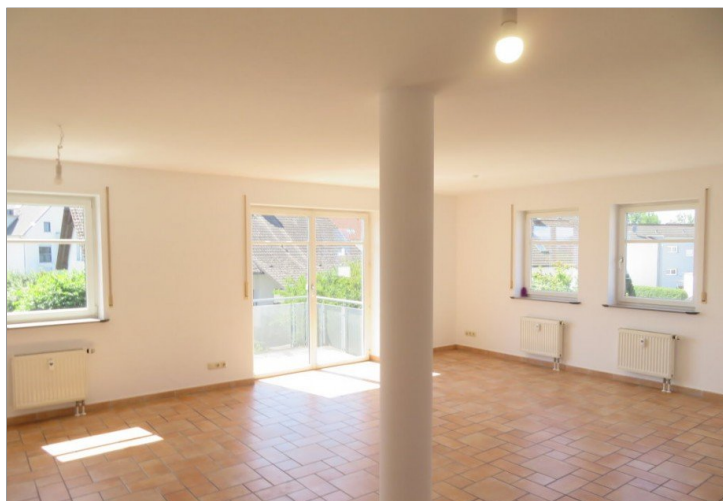
25 Wohnen Essen