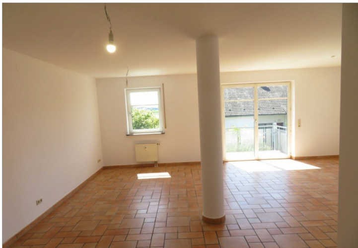
6 Wohnen Essen