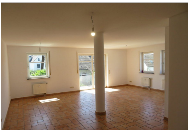
7 Wohnen Essen