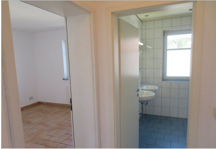
17 Flur+Blick Schlafen