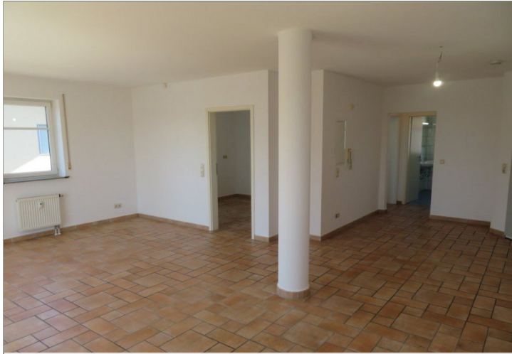
11 Wohnen Essen+Blick Küche