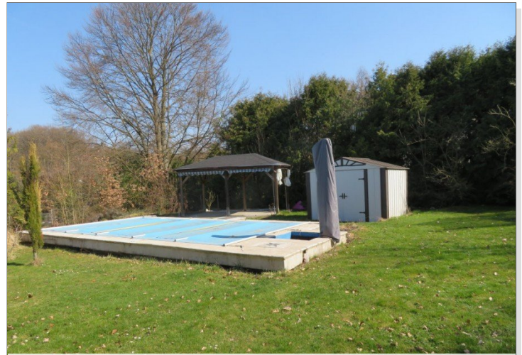
15 Zugang Garten