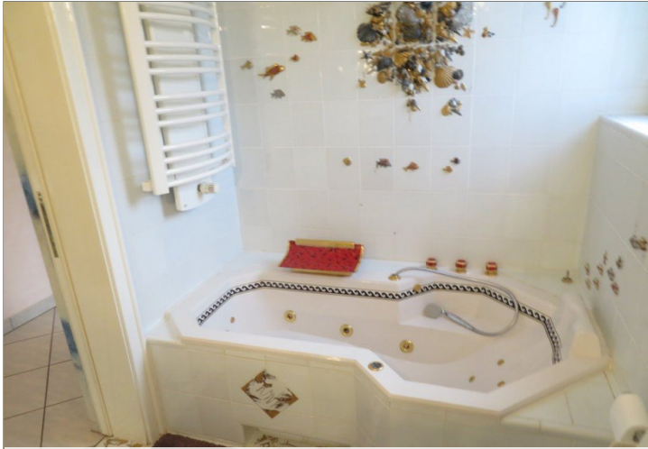
18 Obergeschoss Bad