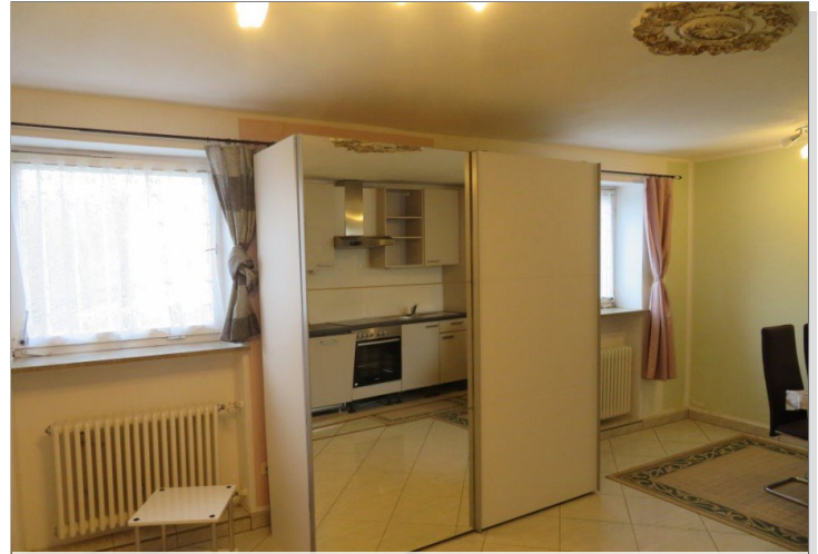
8 Erdgeschoss Zimmer mit Einbauküche