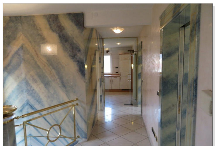
17 Obergeschoss Flur