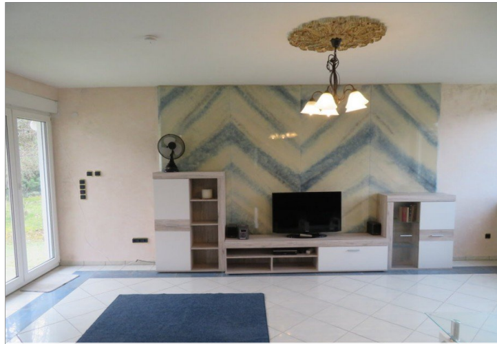
12 Obergeschoss Wohnen