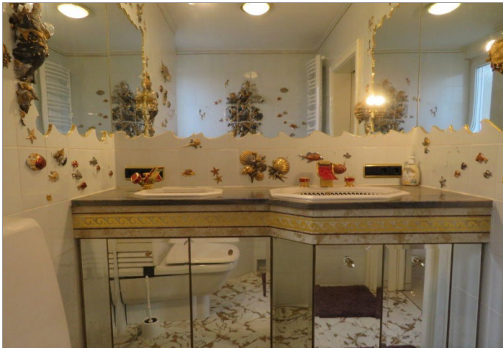
19 Obergeschoss Bad