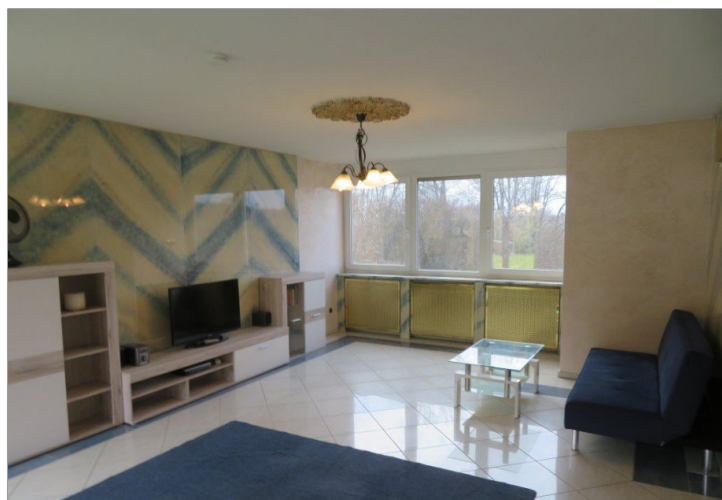
13 Obergeschoss Wohnen