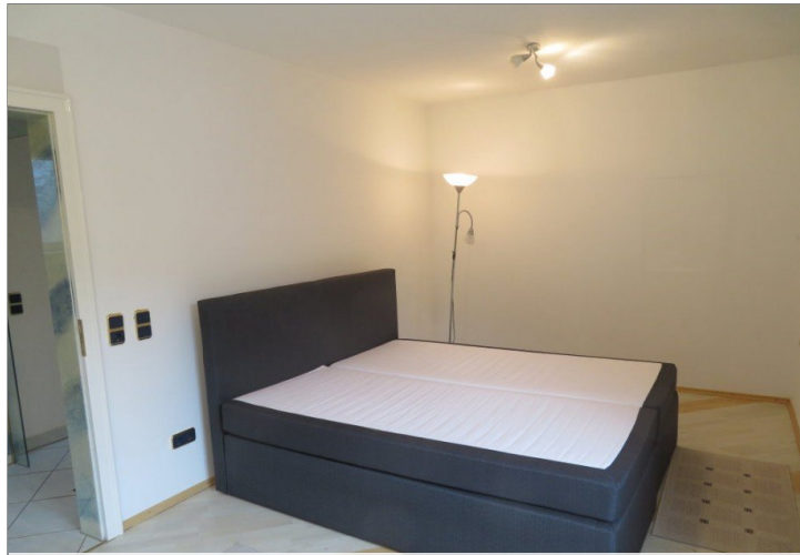
24 Obergeschoss Schlafen