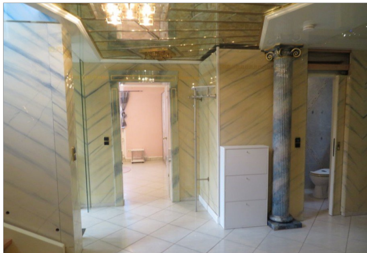
6 Erdgeschoss Eingang Diele+Blick Zimmer