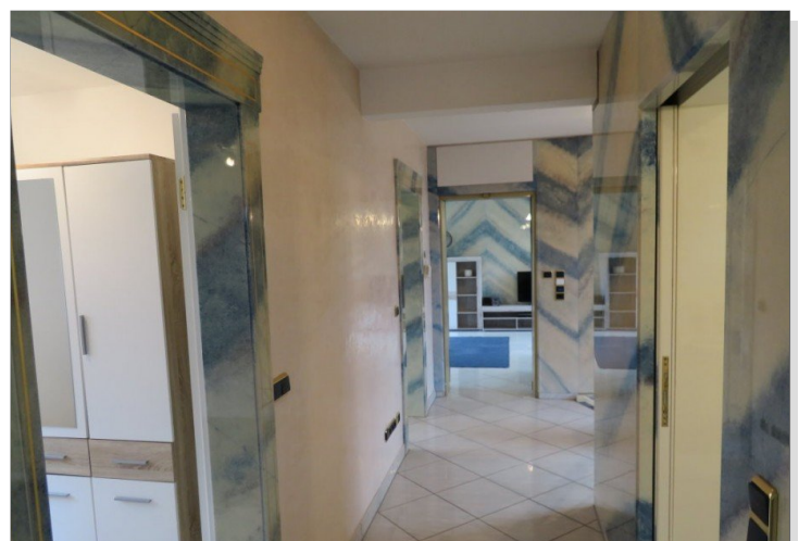
11 Obergeschoss Flur