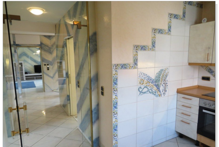
22 Obergeschoss Küche+Blick Flur