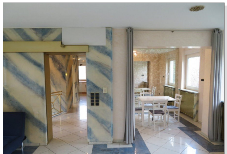
16 Obergeschoss Wohnen