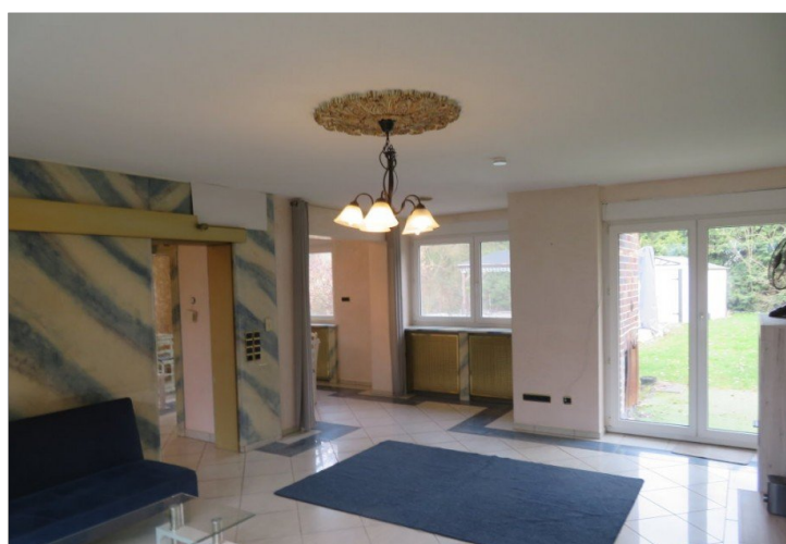
14 Obergeschoss Wohnen