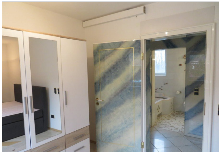
25 Obergeschoss Schlafen+Blick Bad