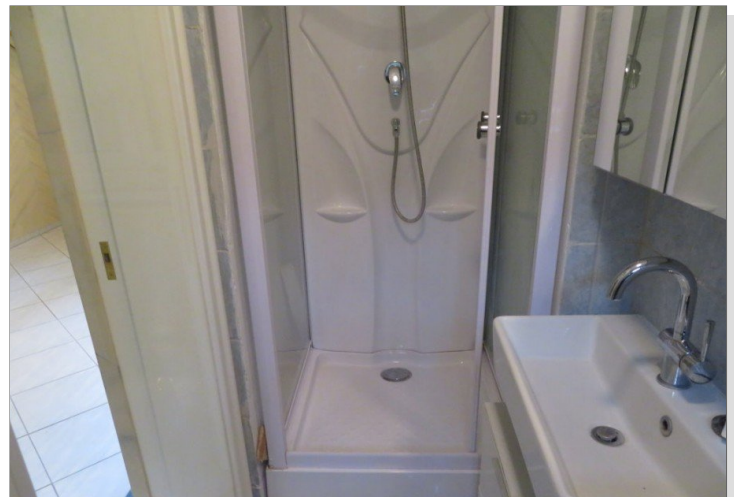
9 Erdgeschoss Dusche WC