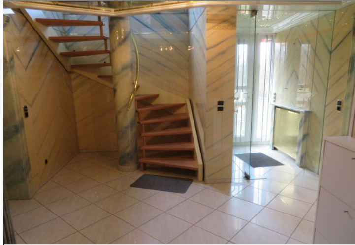
5 Erdgeschoss Eingang Diele