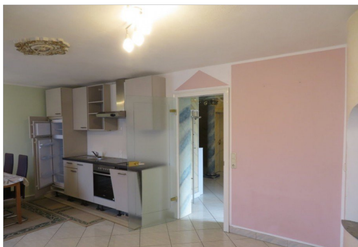
7 Erdgeschoss Zimmer mit Einbauküche