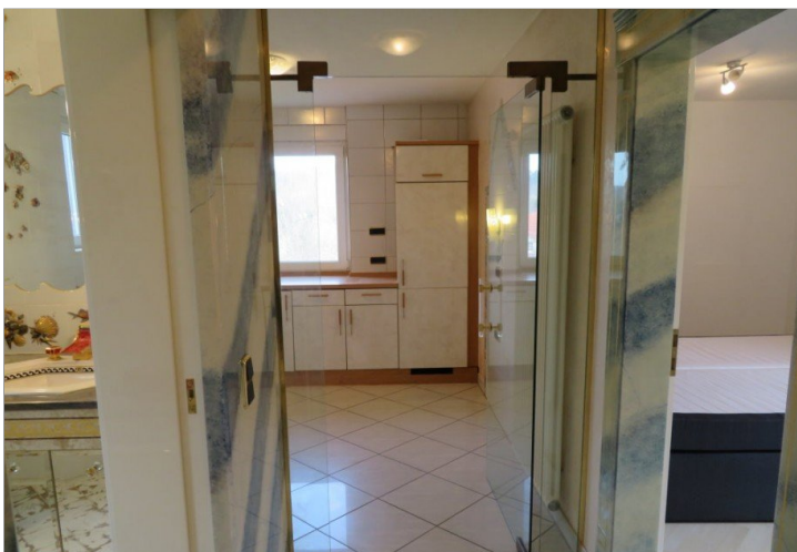
20 Obergeschoss Flur+Blick Küche