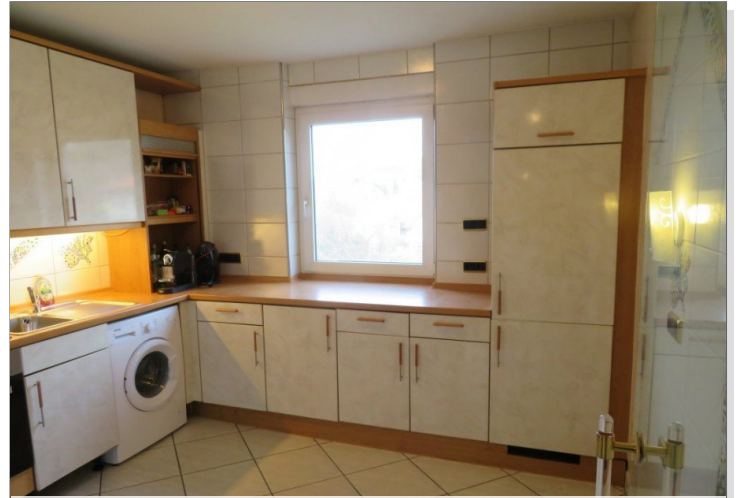
21 Obergeschoss Küche