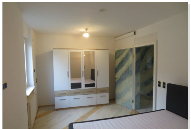
23 Obergeschoss Schlafen